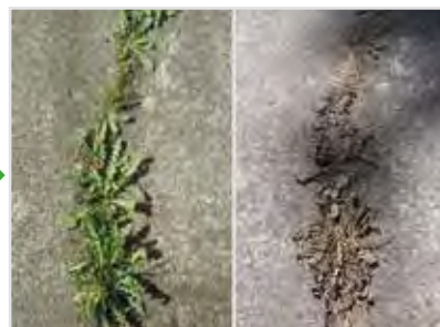
Før behandling 3-5 dage efter behandling