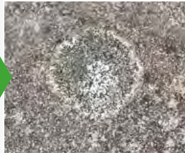
Svamp 2 - 5 dage efter behandling