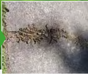
Ukrudt på fortovet 2 - 5 dage efter behandling