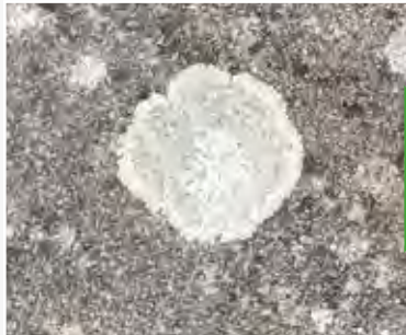
Svamp før behandling