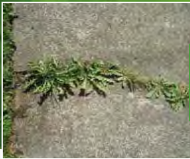
Ukrudt på fortovet