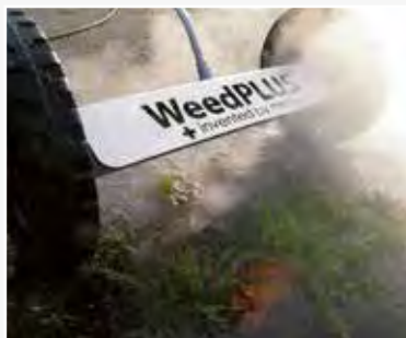
Sprøjtestang 50 cm.